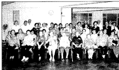
香英之夜濟濟一堂