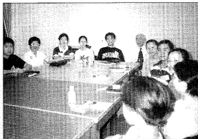
分班研討聖經之地方